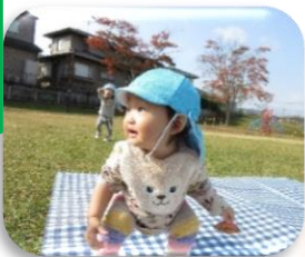
大きなお芋にびっくり!!